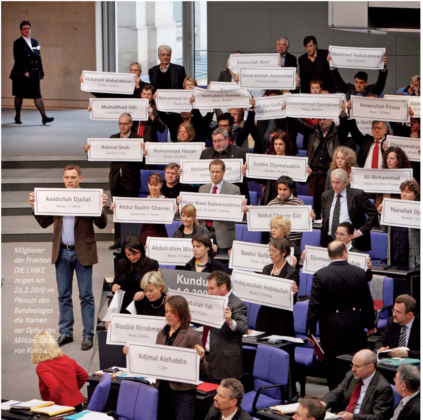
Mitglieder der Fraktion DIE LINKE zeigen am 26.2.2010 im Plenum des Bundestages die Namen der Opfer des Militäreinsatzes von Kundus.